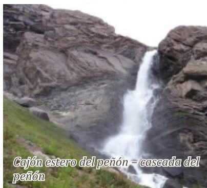
Cajón estero del peñón - cascada del peñón