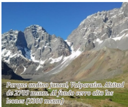
Parque andino juncal, Valparaíso. Altitud de 2789 msnm. Al fondo cerro alto los leones (5380 msnm)