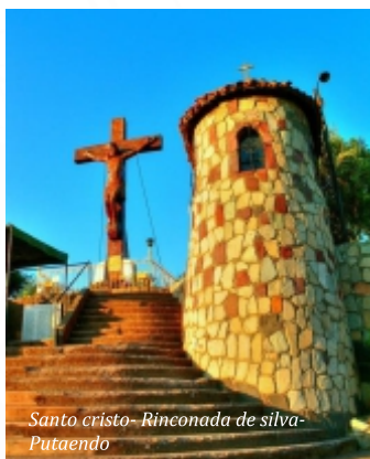
Santo cristo- Rincónada de Silva- Putaendo