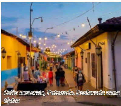
Calle comercio, Putaendo. Declarada zona típica